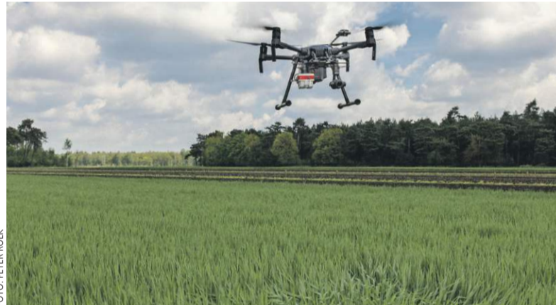
In het 'netto positief' voedselsysteem van HAS-studenten is het met andere drones mogelijk gewassen door elkaar heen te laten groeien.

Frederike Praasterink, Heleen Prins, en Marjo Baeten, respectievelijk lector en docent-onderzoekers in het lectoraat Future Food System bij HAS Hogeschool in 's-Hertogenbosch.