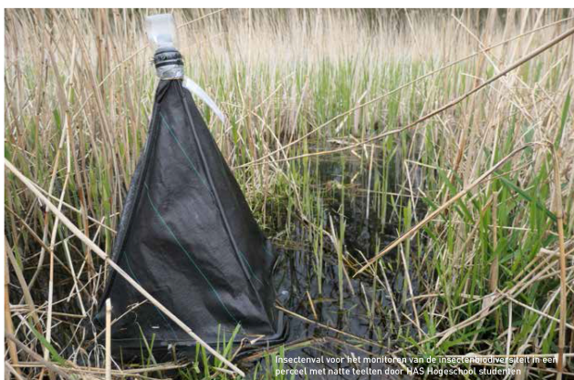
Insectenviel voor het monitoren van de insectenrijkdiversiteit in een perceel met natte teelten door HAS Hogeschool studenten